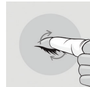
Abbildung 2: Reinigen der Augenlider und Wimpern

Massieren Sie sanft mit kleinen kreisenden Bewegungen und entfernen Sie eventuelle Krusten, Sekrete oder Make-up.