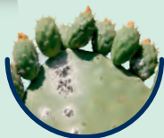
Kupferacetat Cuprum aceticum