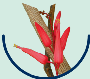
Picrasma excelsa Quassia amara Quassiaholz