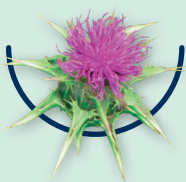
Carduus marianus Mariendistel